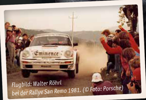
Flugbild: Walter Röhrl bei der Rallye San Remo 1981.