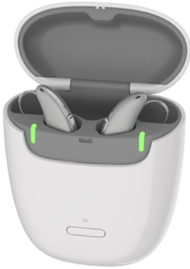
Pure Charge&Go AX - Das neue Hörgerät von Signia